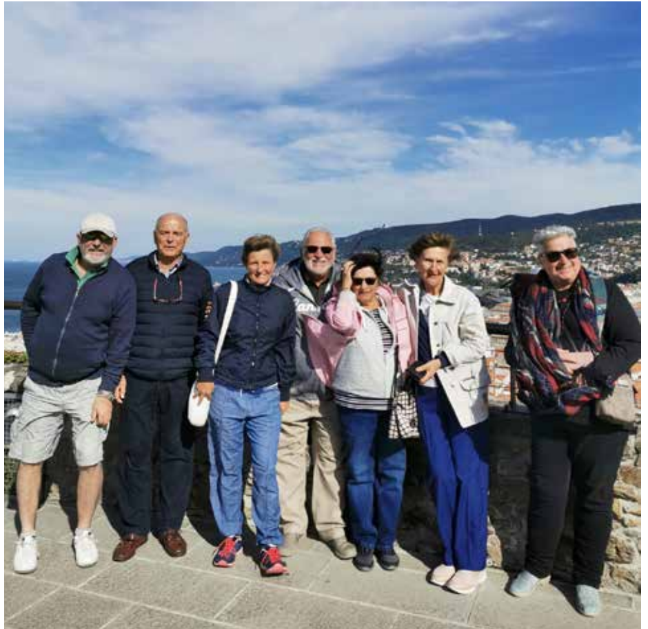
➤ Due immagini delle passate escursioni, rispettivamente al Castello di Miramare (a lato) e sul Bastione Fiorito del colle di San Giusto (sopra)

D a una parte le giovani generazioni, invitate a Trieste per conoscere il territorio dal quale sono emigrati nei decenni passati i loro genitori, i nonni o gli zii. Dall'altra, invece, il progetto che intende riportare nella nostra regione chi ha superato i 65 anni e ha sempre vissuto lontano, pur essendo di origine giuliana o istriana. È questo il contenuto dell'iniziativa denominata “Soggiorno anziani 2022” e che ha come obiettivo, come già successo negli