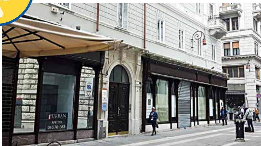
▶ La sede dell'Associazione, situata a Trieste in via Santa Caterina 7

parole "pace" e "speranza" - che in questi ultimi mesi, per quanto accade nel mondo, sembrerebbe orientarsi verso altri lidi... - devono rappresentare la sintesi più alta del nostro vivere su questa terra.